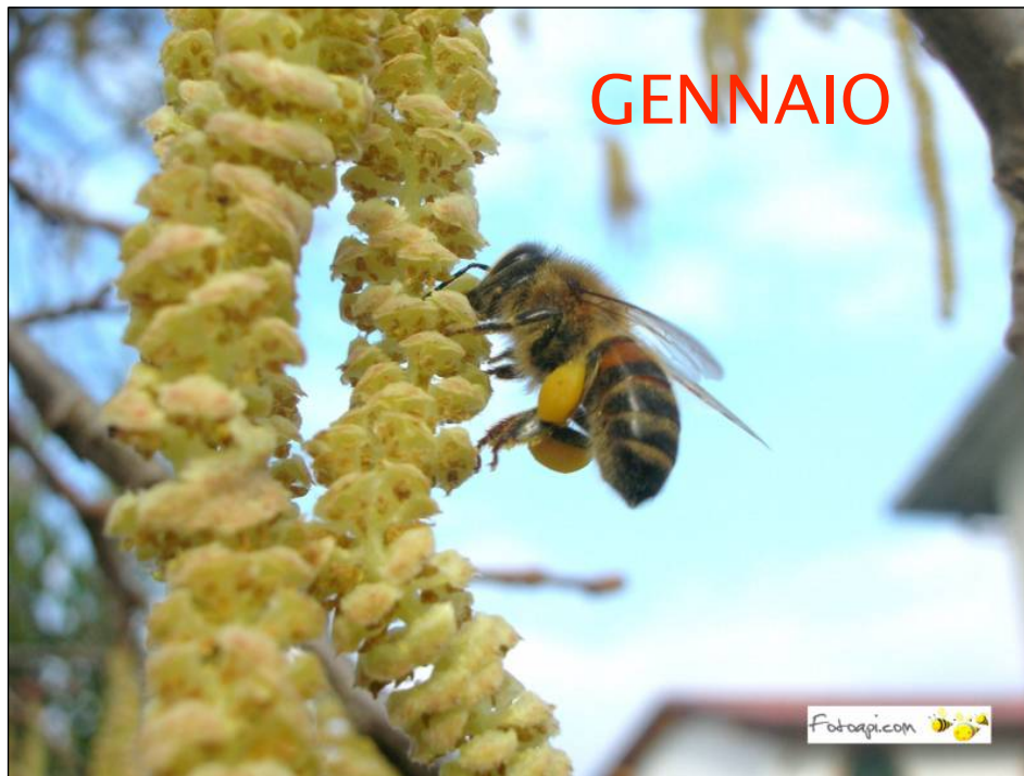
Corylus Avellana -