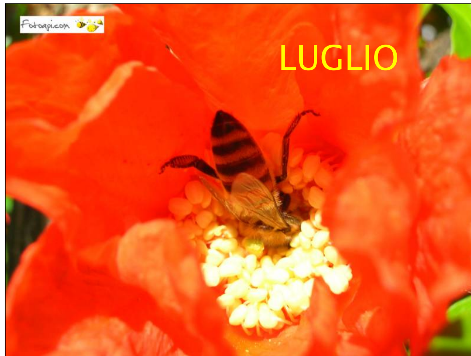
Punica granatum L.